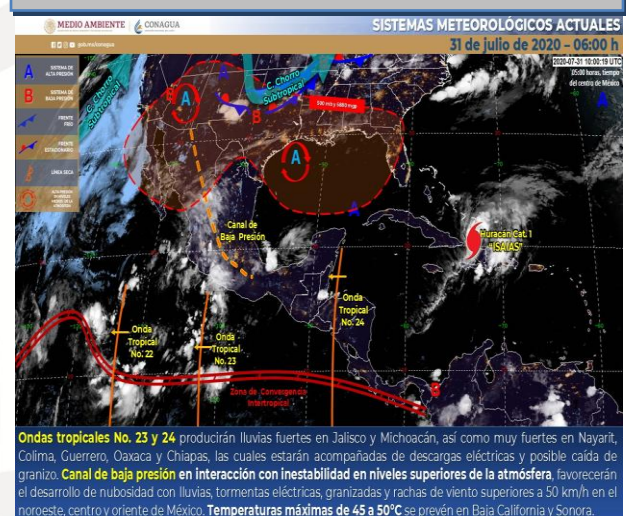
IMAGEN DE SATELITE

Cielo medio nublado durante la mañana e incremento de nubosidad por la tarde, con lluvias puntuales fuertes en Guanajuato, Querétaro, Hidalgo, Morelos , Tlaxcala y Puebla, todas con descargas eléctricas y posible caída de granizo. Ambiente caluroso y viento de dirección variable de 15 a 30 km/h.